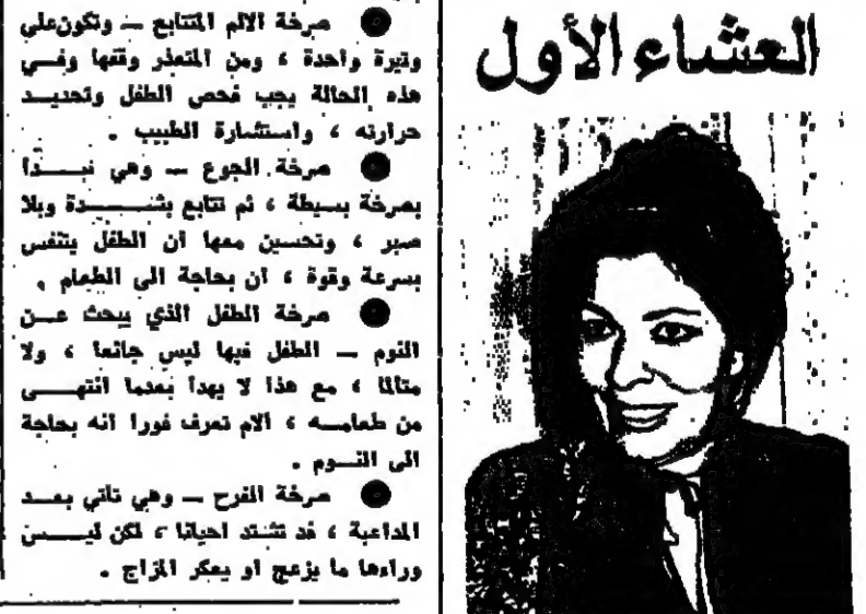
للشاعر العراقية: لميعة عمارة

تميز هذا الحنجر، انه يمكن تديله بعد فراقه بسر زديد جدا، فلا عن انه صار على الموضة.